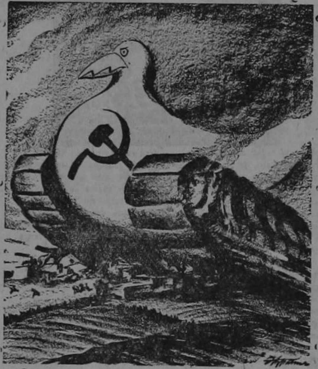
Un coreano da su idea ante el ataque profuso que a su tierra hoy golpea: "El malo dictalol luso lo que quiele es la glan Colea"

(Caricatura publicada en el "St. Louis Post Dispatch", importante periódico de San Louis, Missouri).